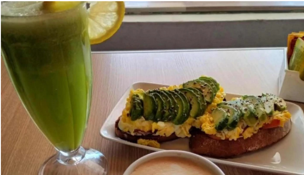
La pausa numero