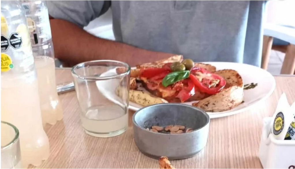
La pausa horario