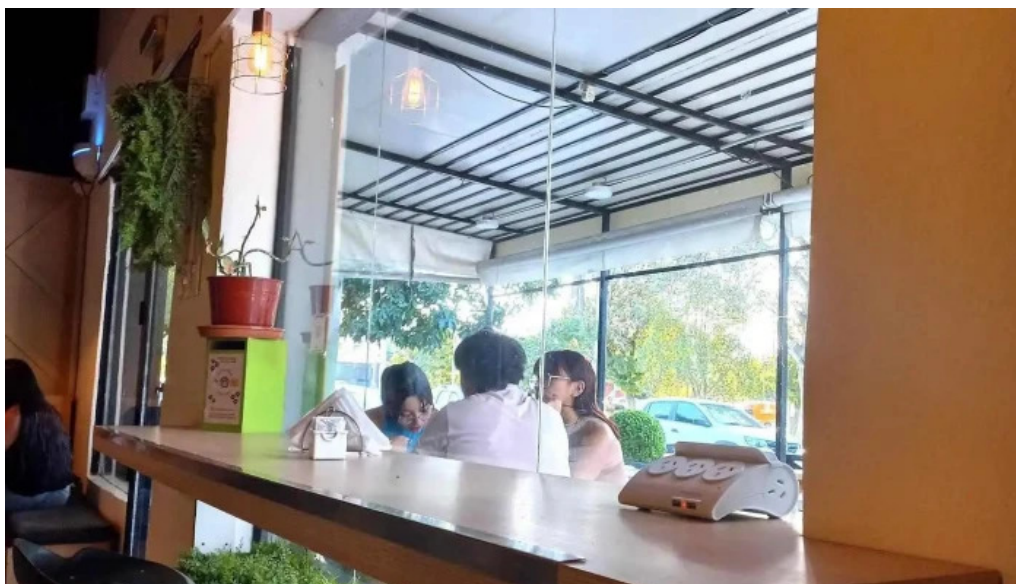
La pausa ambiente