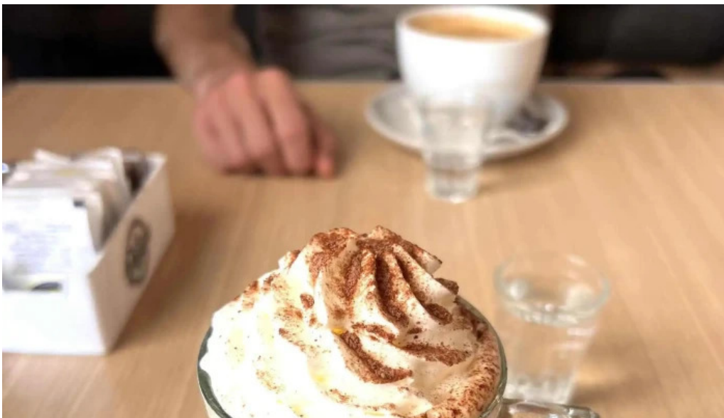
La pausa comentarios