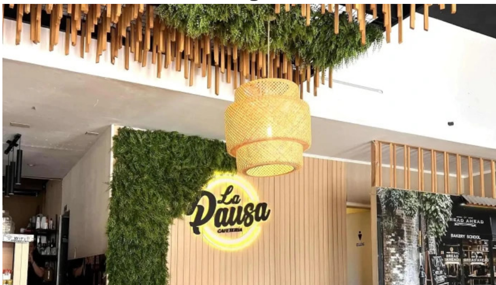
La pausa ubicacion