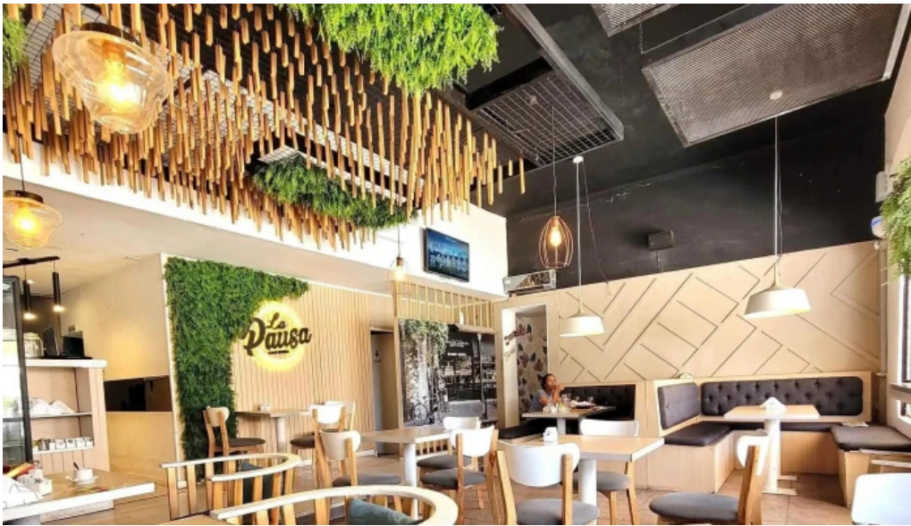
La pausa cinco saltos