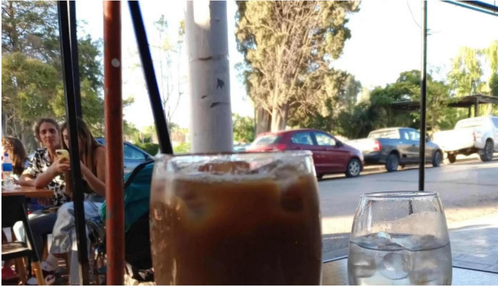
La pausa precios