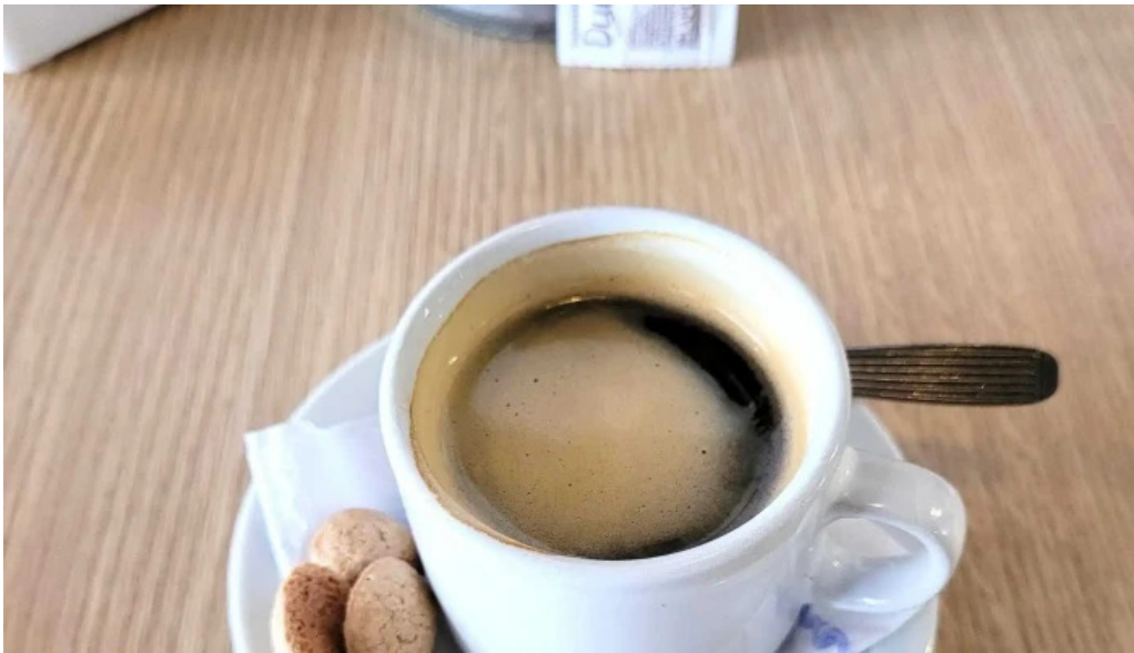
La pausa fotos