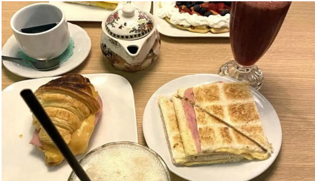
La pausa mas recientes