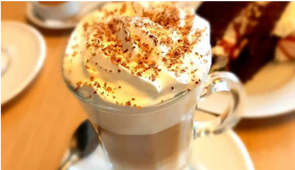
La pausa comida y bebida