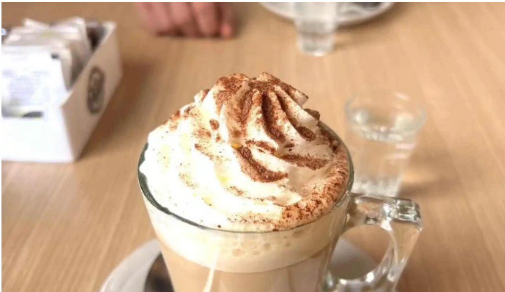
La pausa cafe