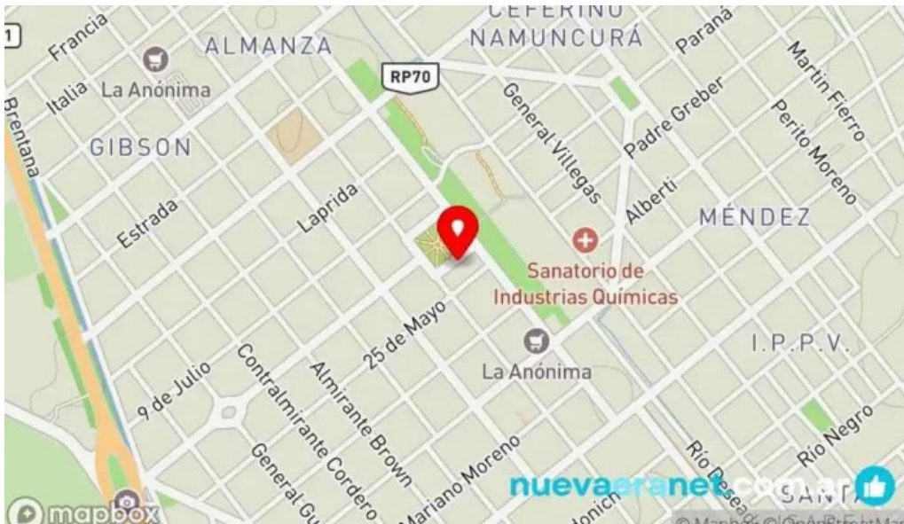
La pausa mapa