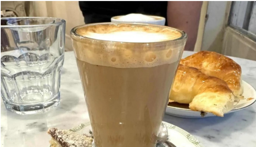
Retamas cdad autonoma de buenos aires