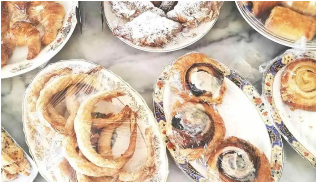
Retamas comida y bebida