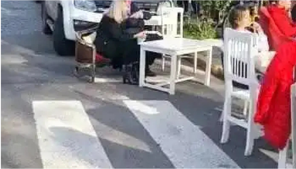
Retamas del propietario