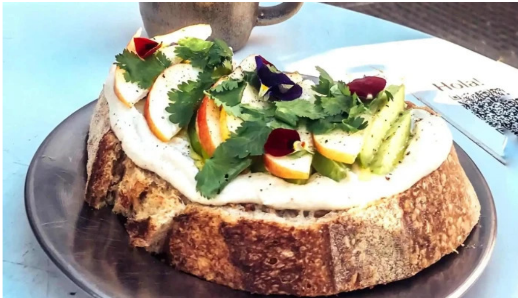
Casa nueva cafe