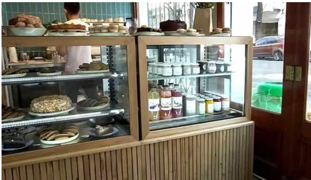
Casa nueva videos