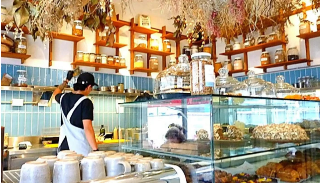
Casa nueva pastel