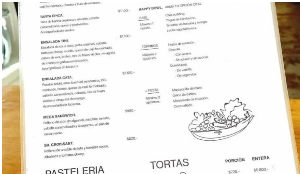
Casa nueva carta