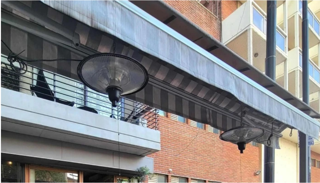
Casa nueva telefono