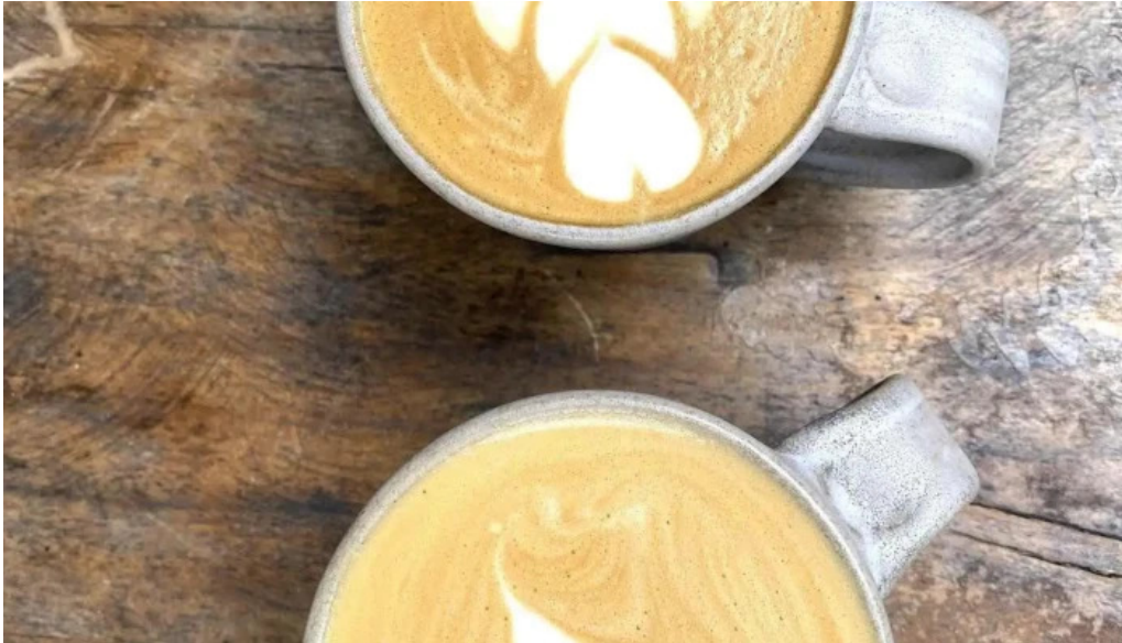
Casa nueva cafe latte