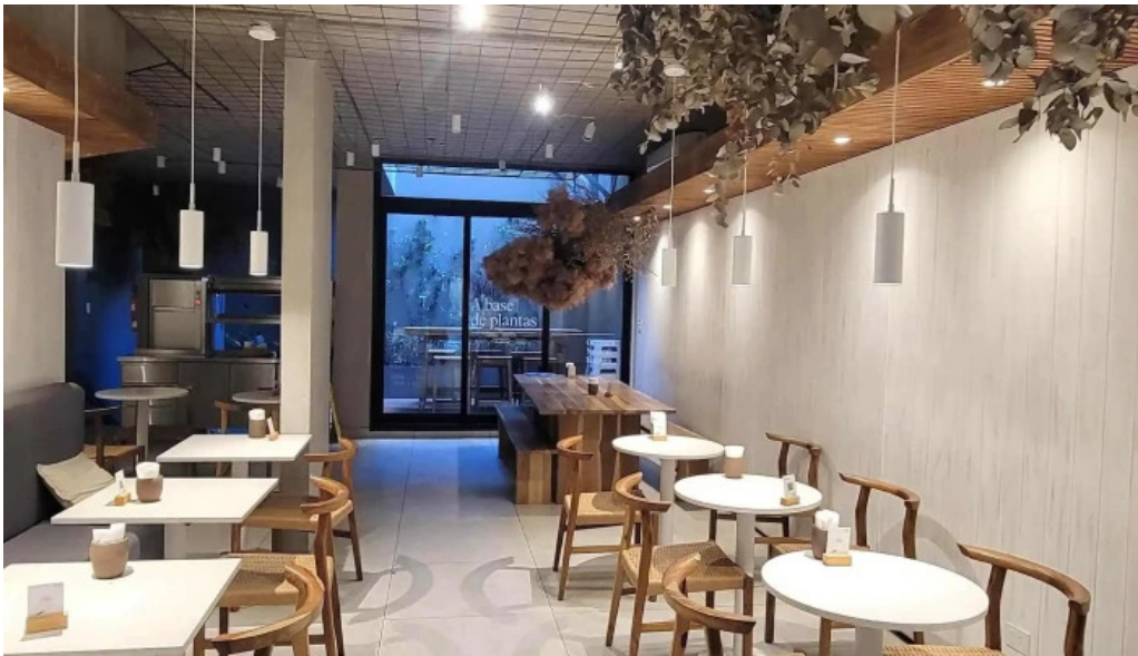
Casa nueva sitio web