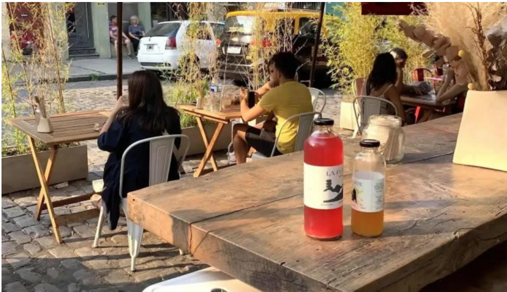
Casa nueva ambiente