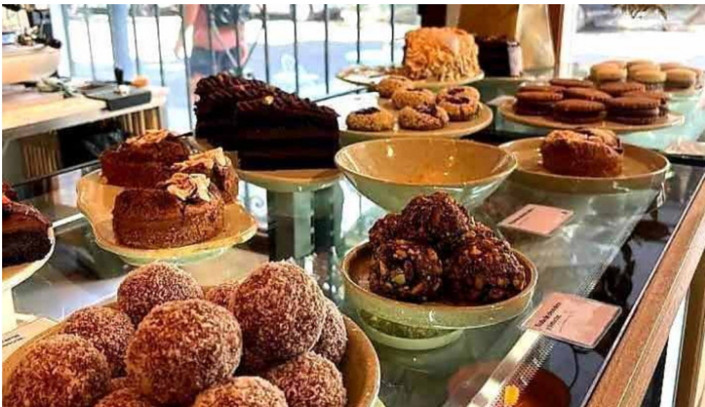
Casa nueva comida y bebida