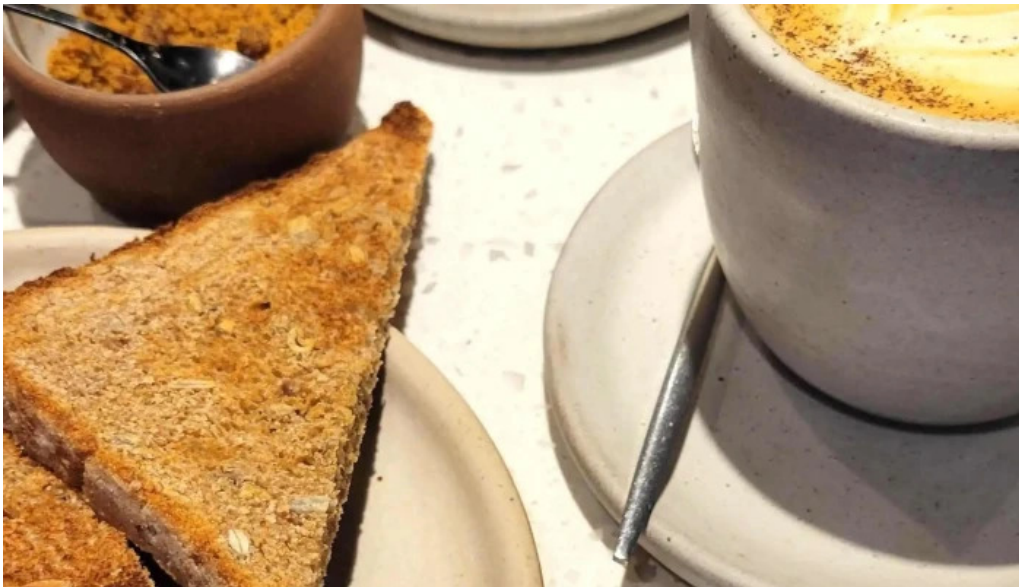
Casa nueva como llegar