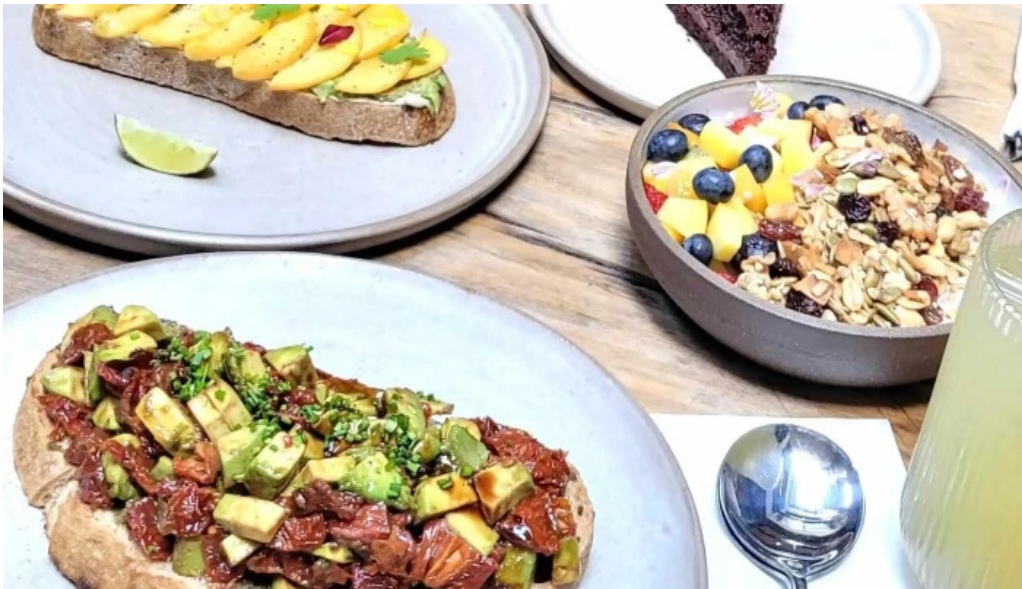
Casa nueva catalogo