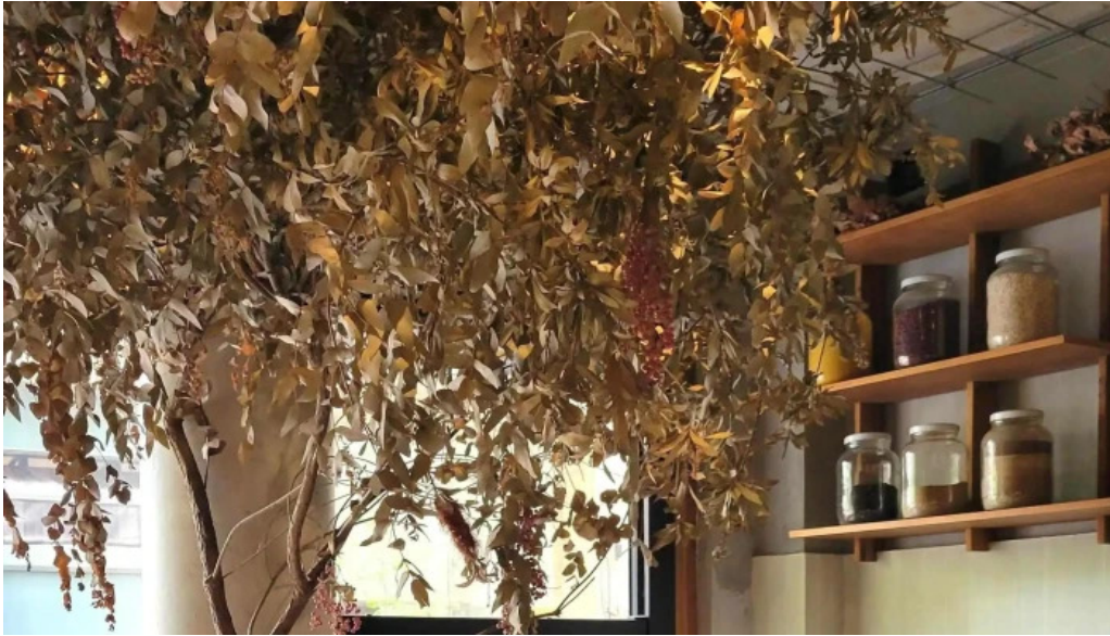
Casa nueva cdad autonoma de buenos aires