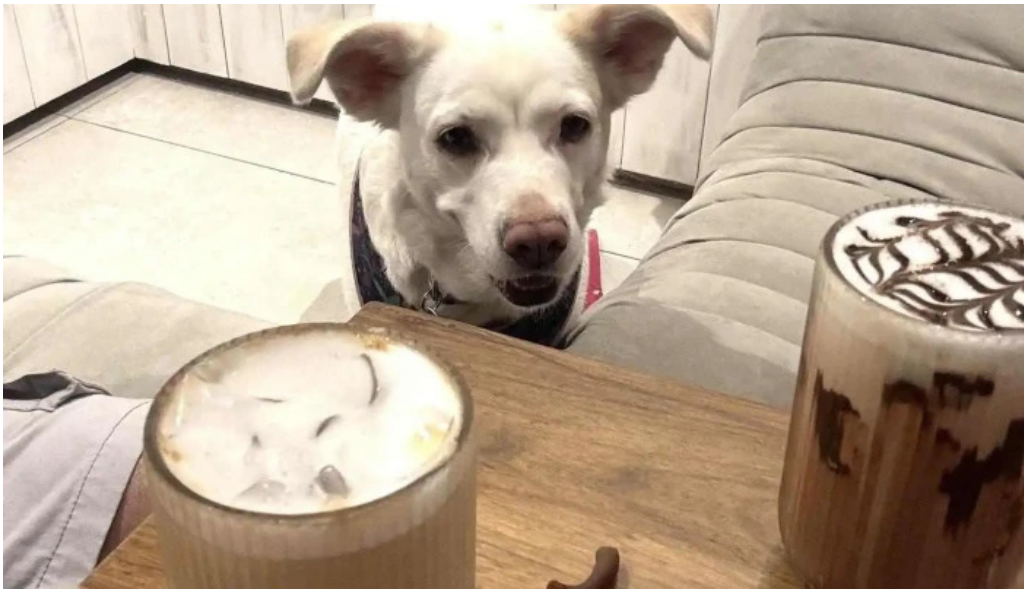
Casa nueva mas recientes