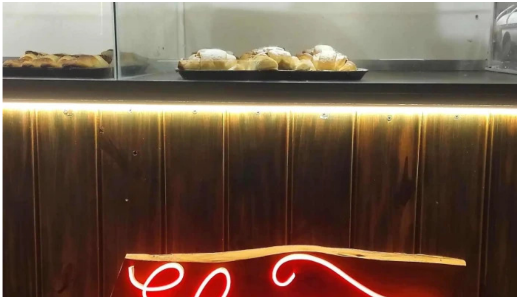
El wero como llegar