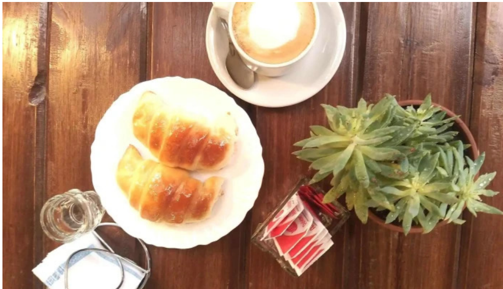
El wero croissant