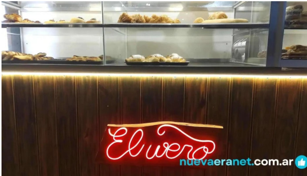
El wero ambiente