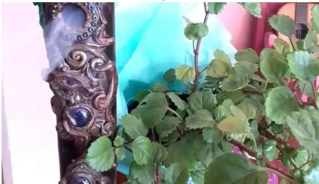
El wero videos