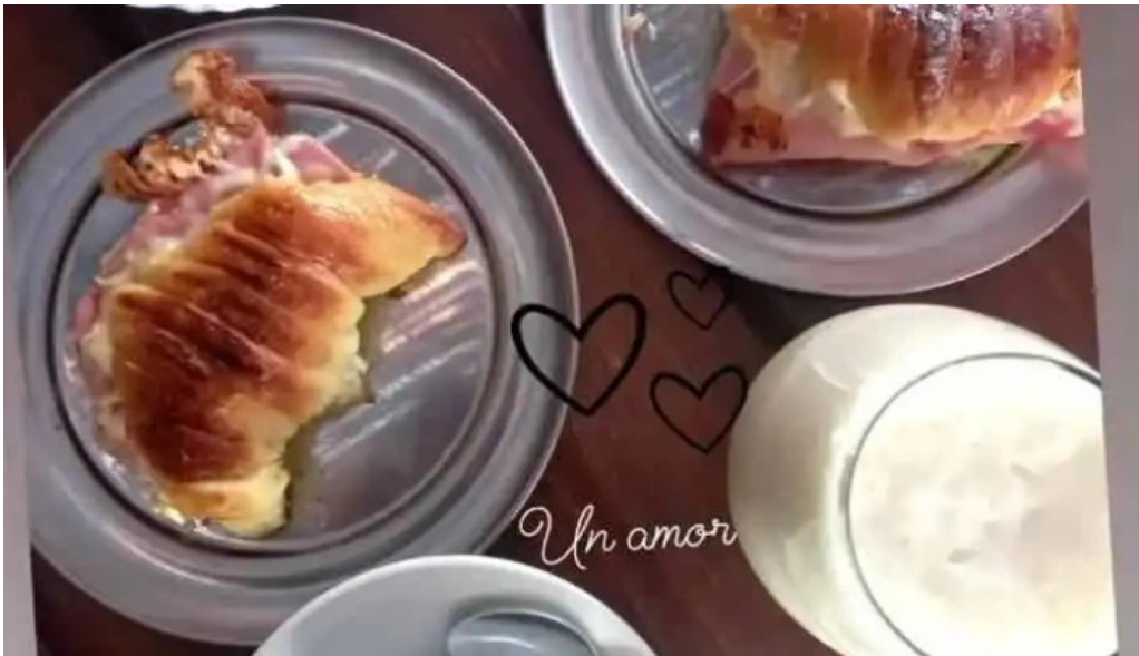
El wero carta