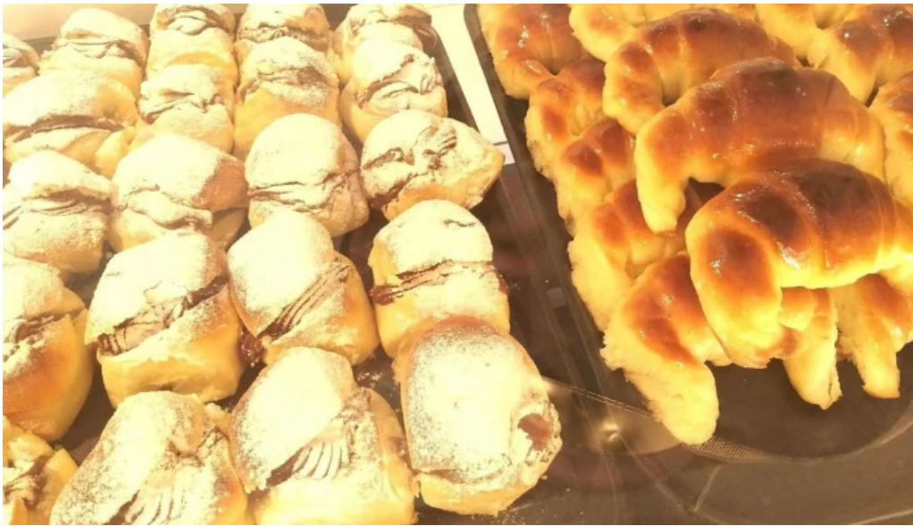
El wero comida y bebida