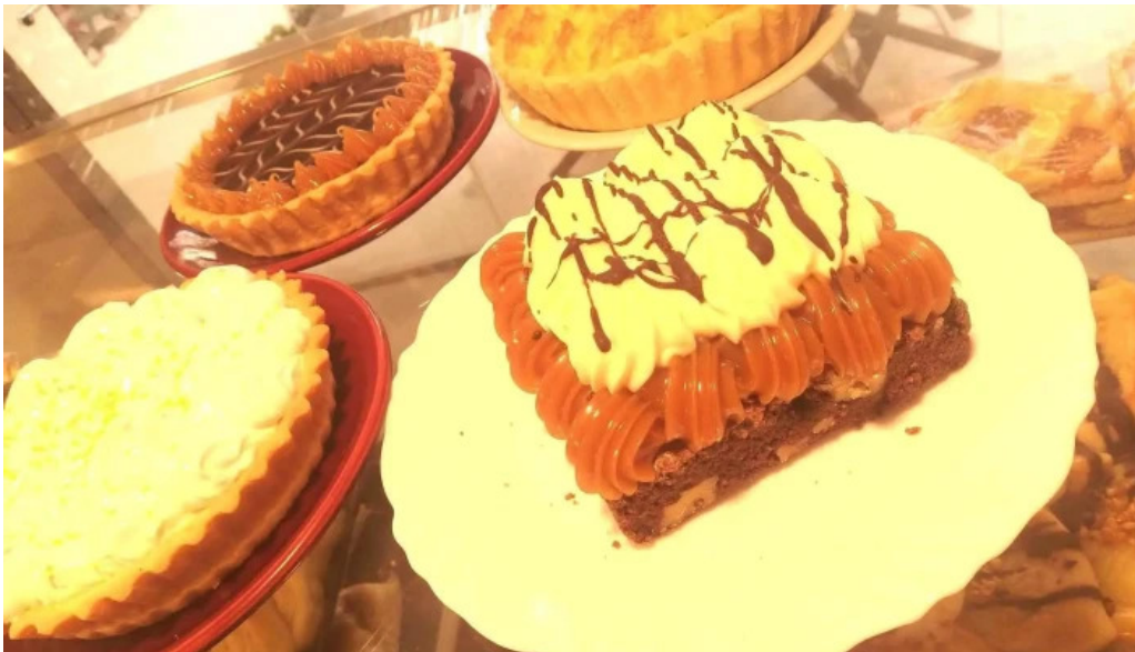
El wero pastel