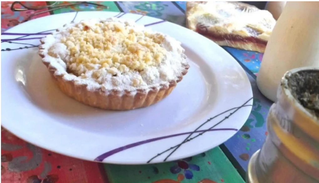
El wero capilla del monte