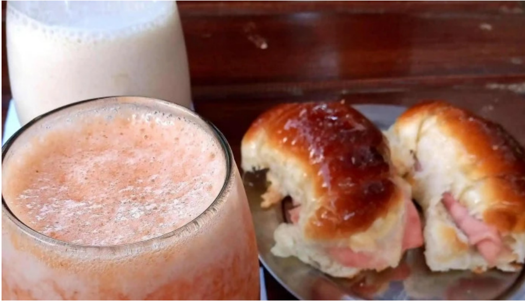
El wero ubicacion