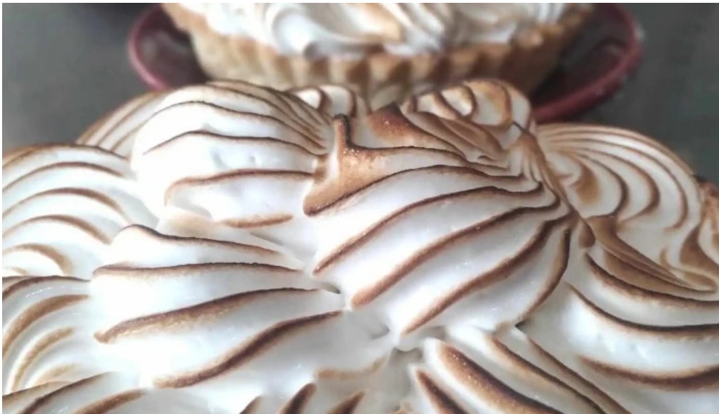
El wero del propietario