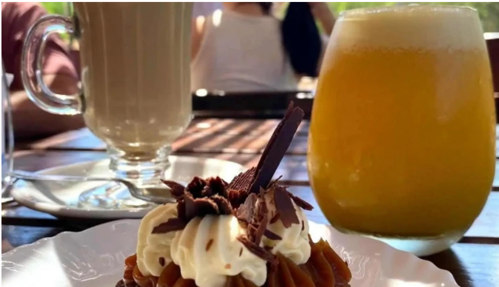
El wero cafe