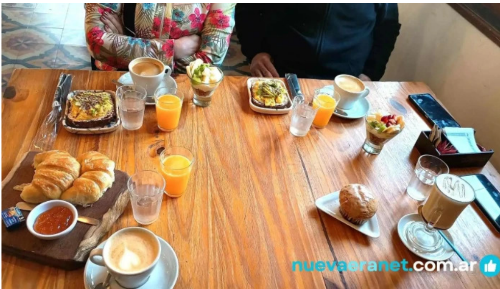
La creacion cafe