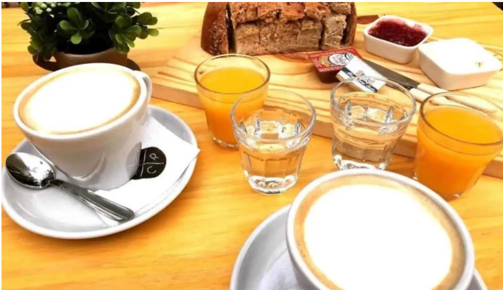
La creacion comida y bebida