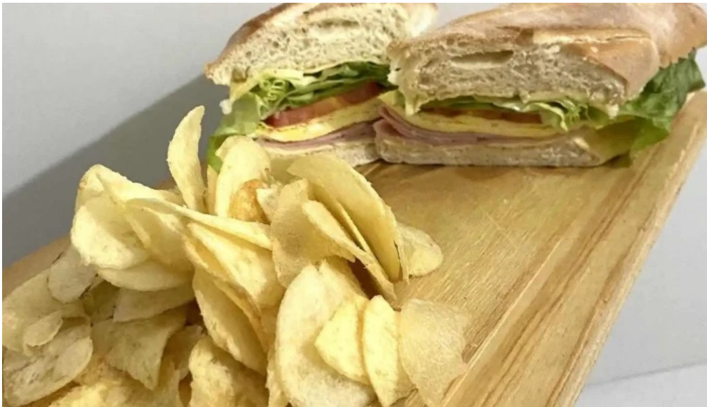
La creacion del propietario