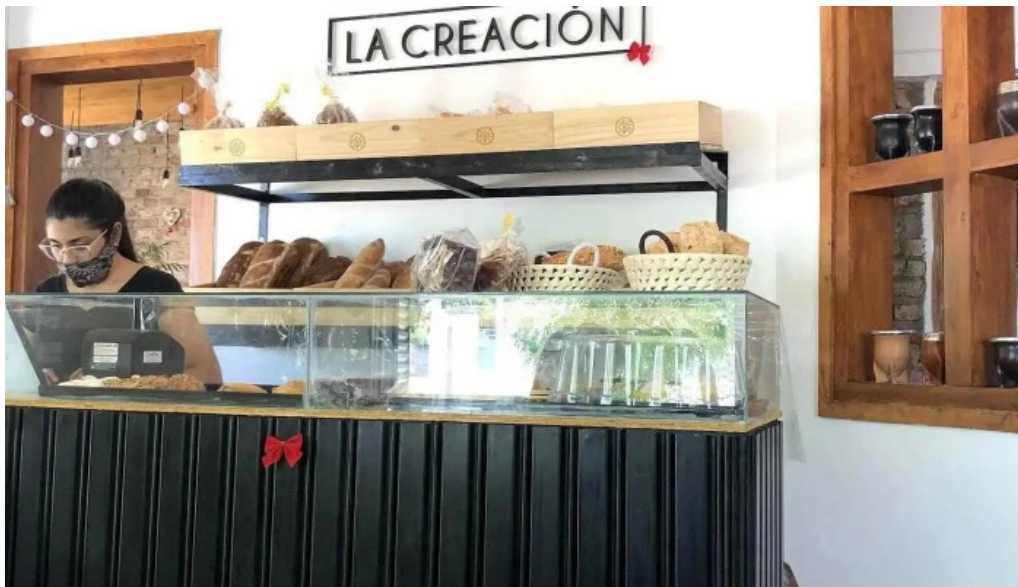
La creacion ambiente