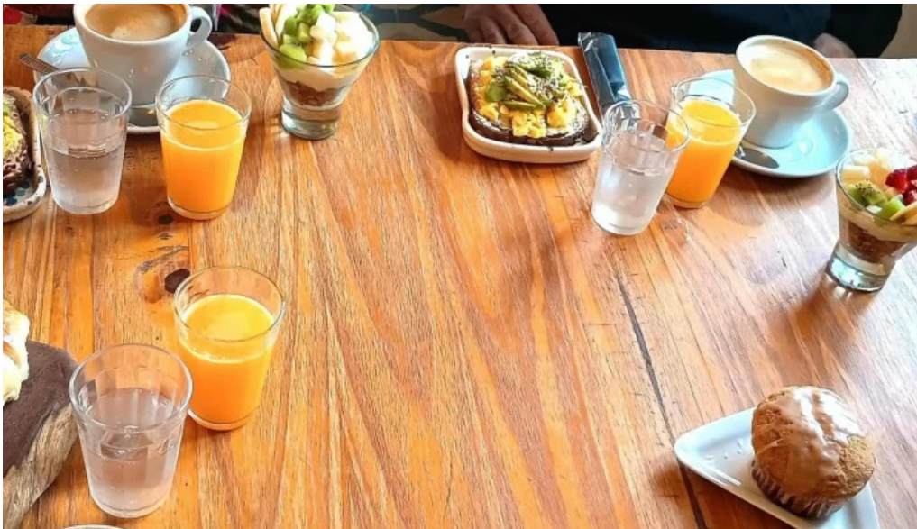
La creacion alta gracia