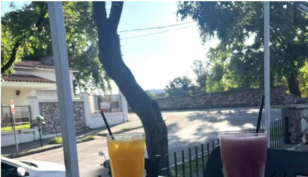
La creacion instagram