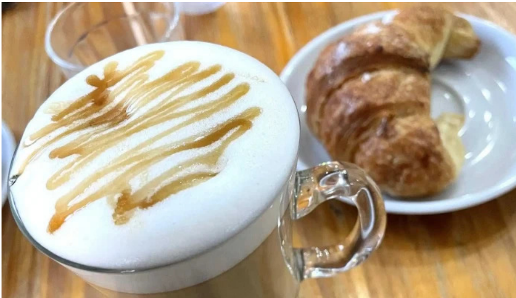
La creacion opiniones