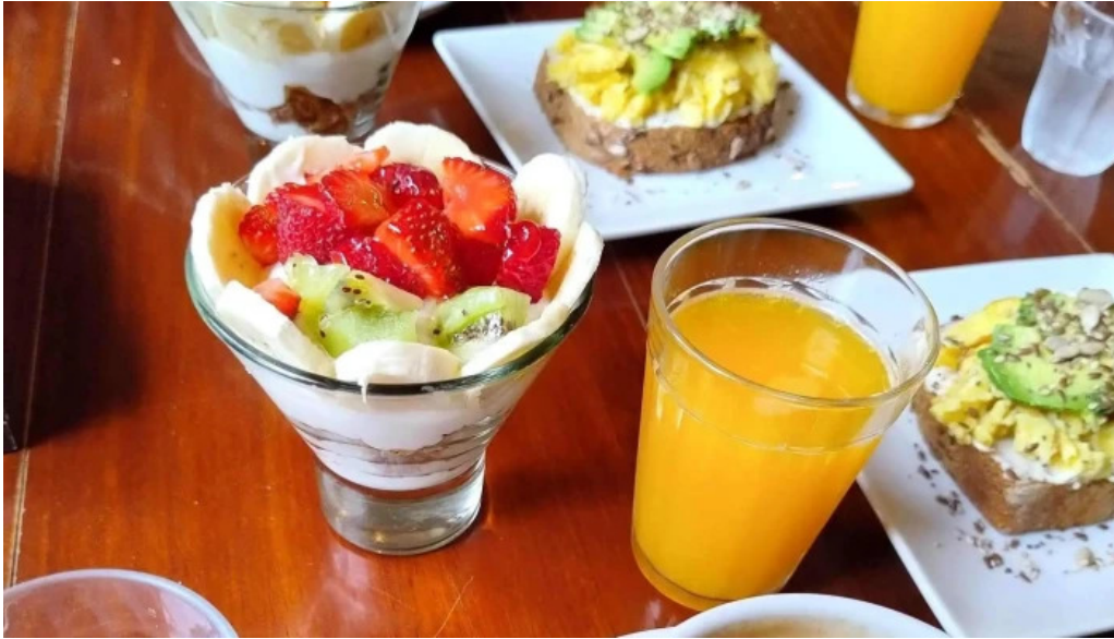
La creacion direccion