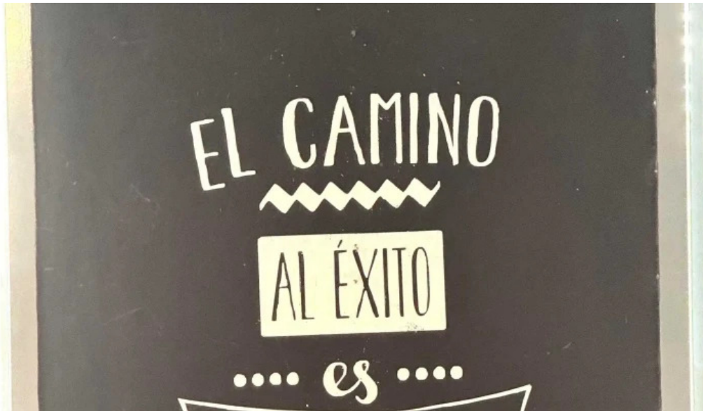
La creacion sitio web