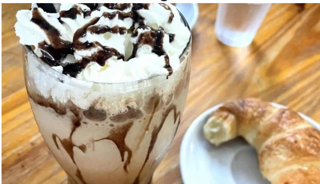
La creacion videos