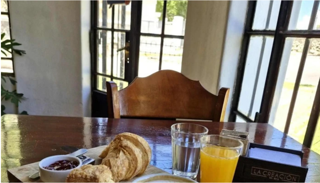
La creacion como llegar