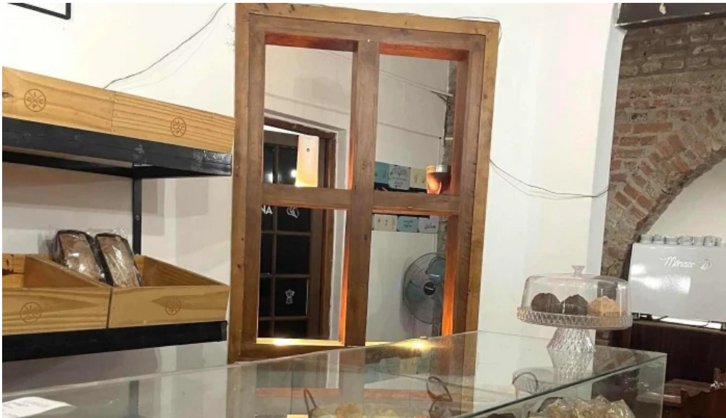
La creacion catalogo