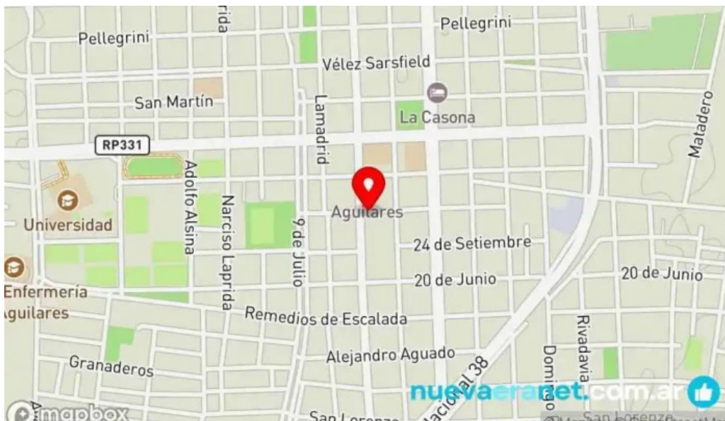
Daiana abregu cafe bar mapa