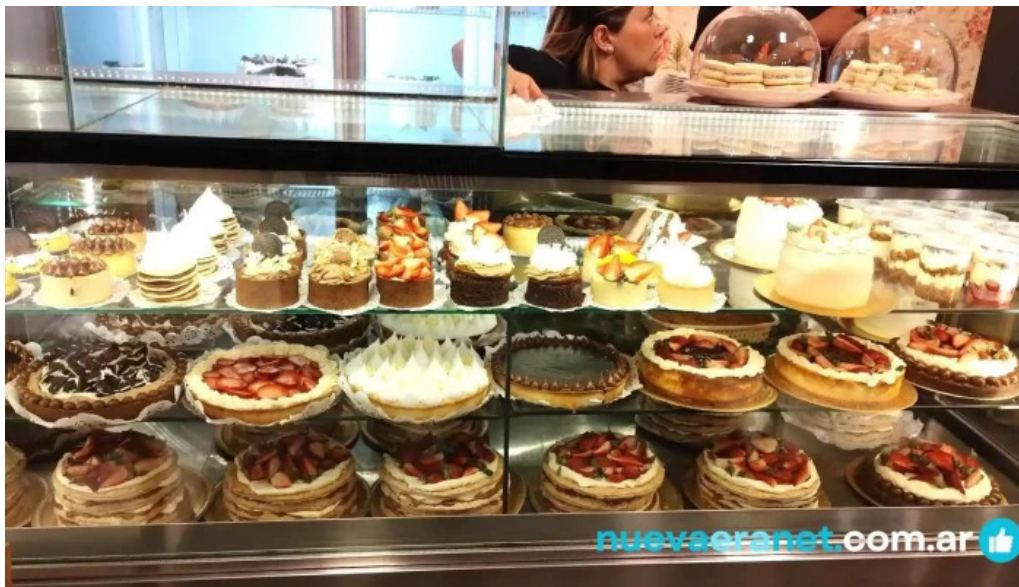
Daiana abregu • cafe bar aguilares