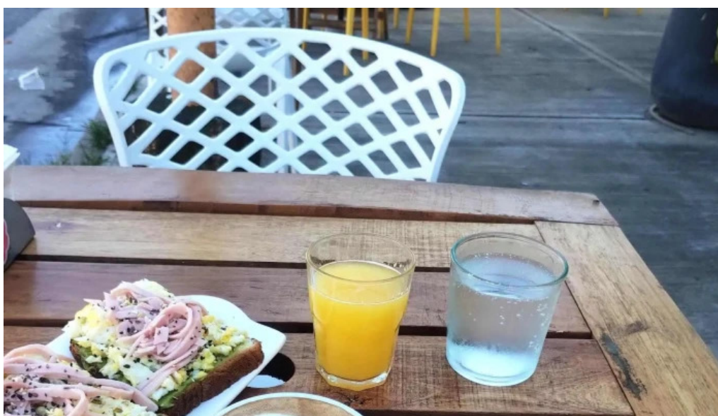
Daiana abregu cafe bar aguilares