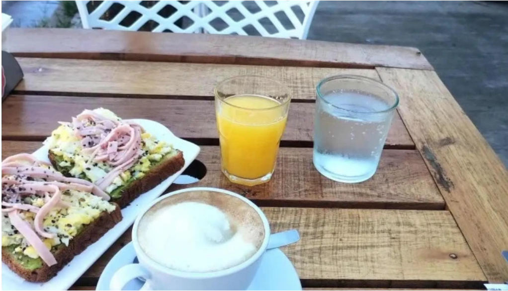
Daiana abregu cafe bar recientes