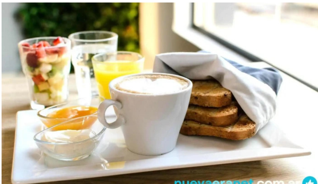
Daiana abregu cafe bar cafe