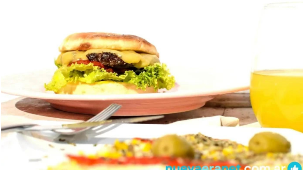
Daiana abregu cafe bar hamburguesa