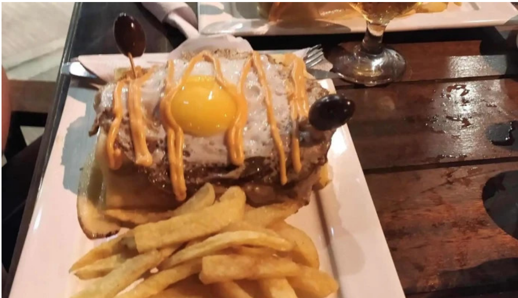
Daiana abregu cafe bar ubicacion