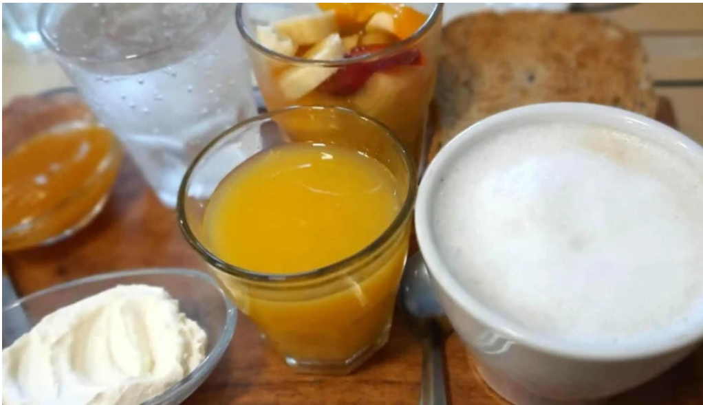
Daiana abregu cafe bar puntaje