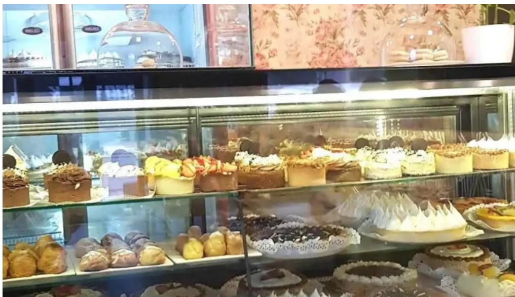
Daiana abregu cafe bar ambiente