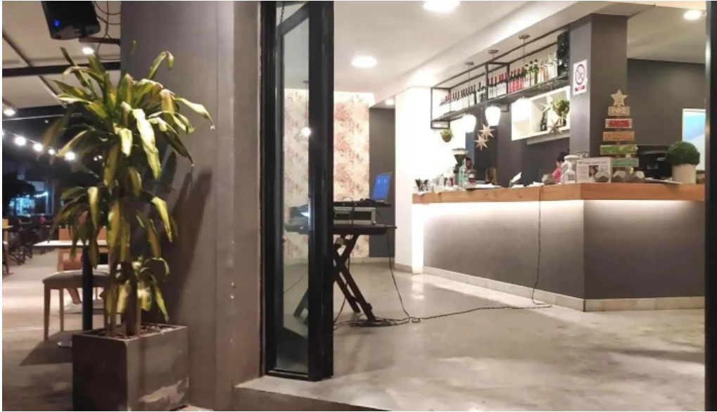
Daiana abregu cafe bar descuentos