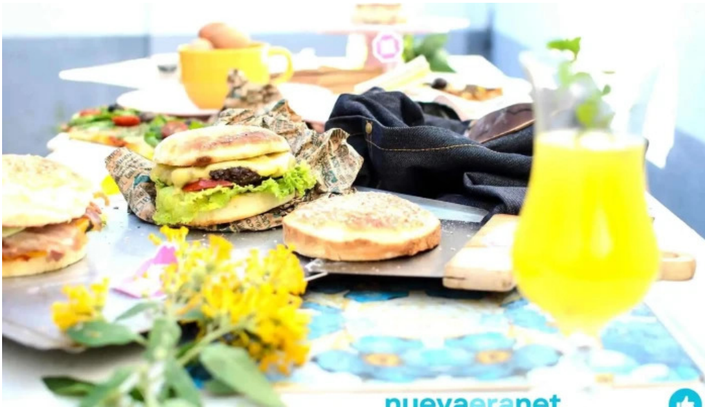
Daiana abregu cafe bar comidas y bebidas