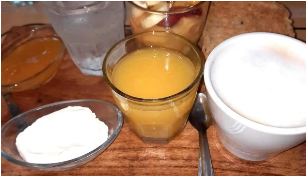
Daiana abregu cafe bar videos