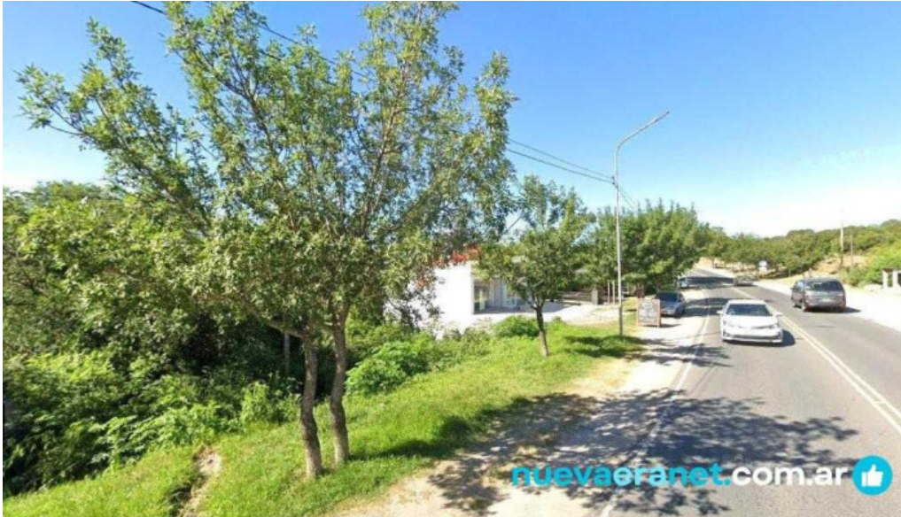
Pan caliente panaderia cafeteria agua de oro