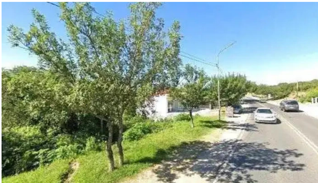
Pan caliente panaderia cafeteria cafeteria