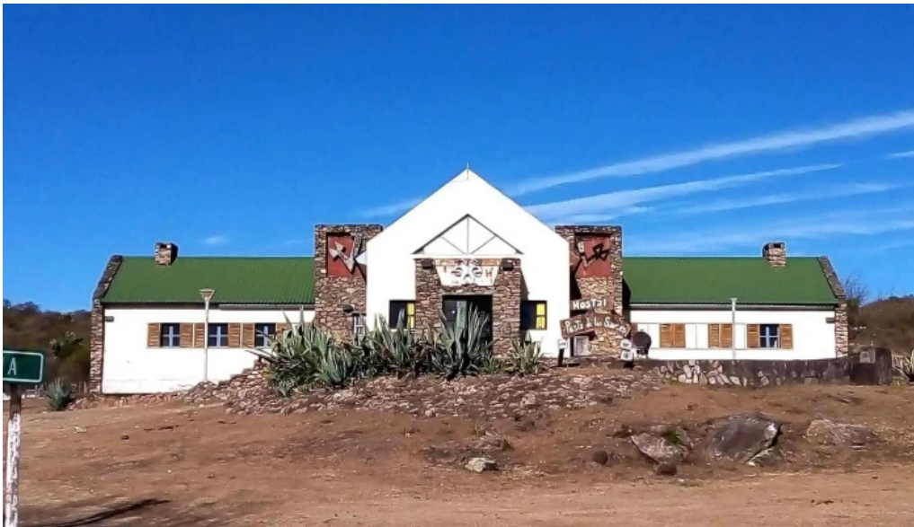
Posta de los sauces exterior