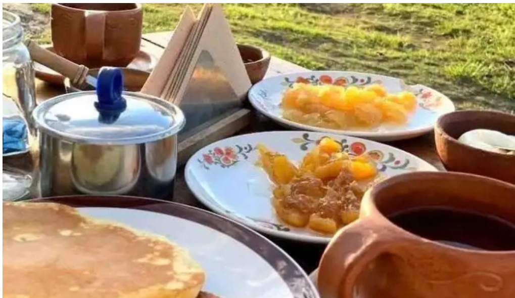
Posta de los saucos de los visitantes