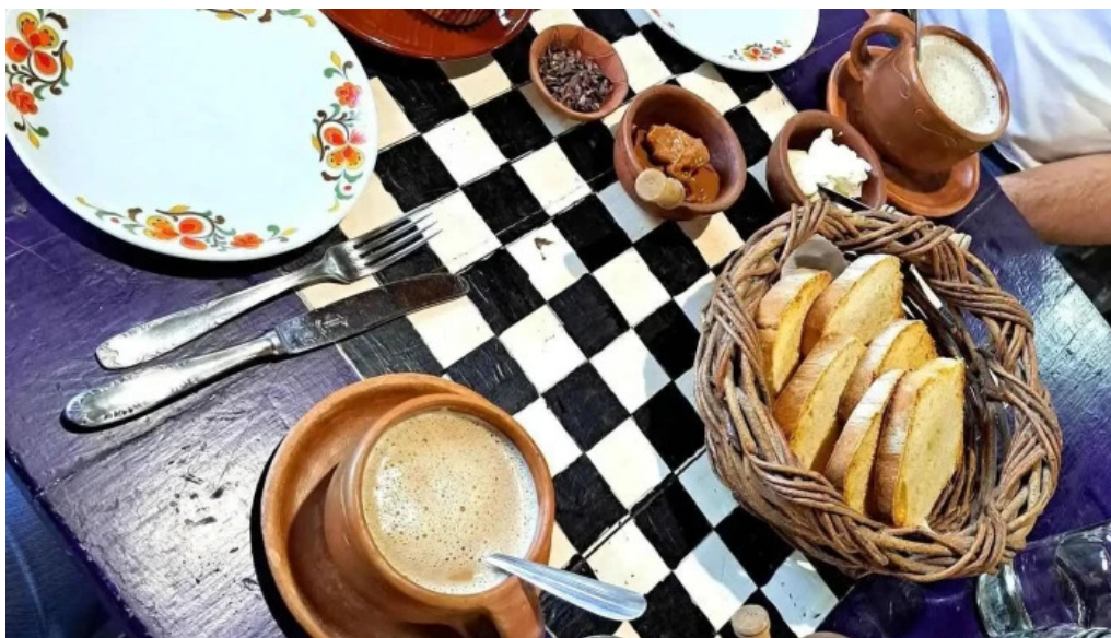
Posta de los sauces comida y bebida