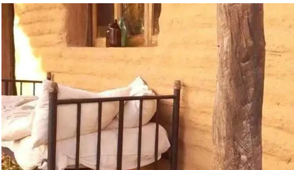
Posta de los sauces anquincila