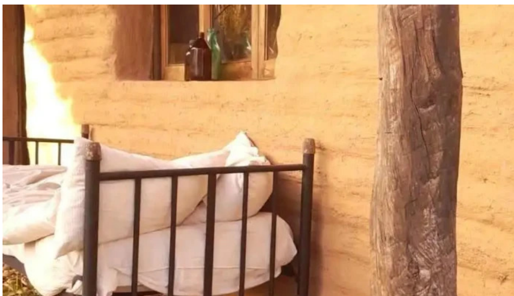
Posta de los sauces puntaje