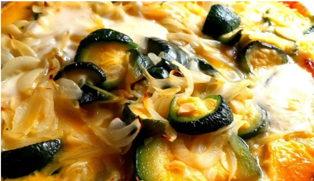
Posta de los sauces mas recientes