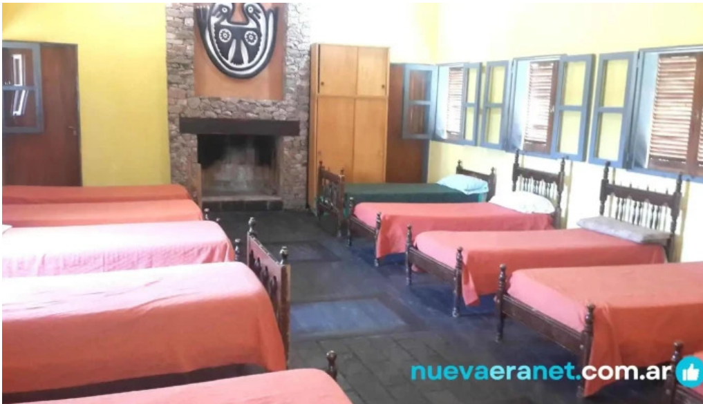
Posta de los sauces habitaciones