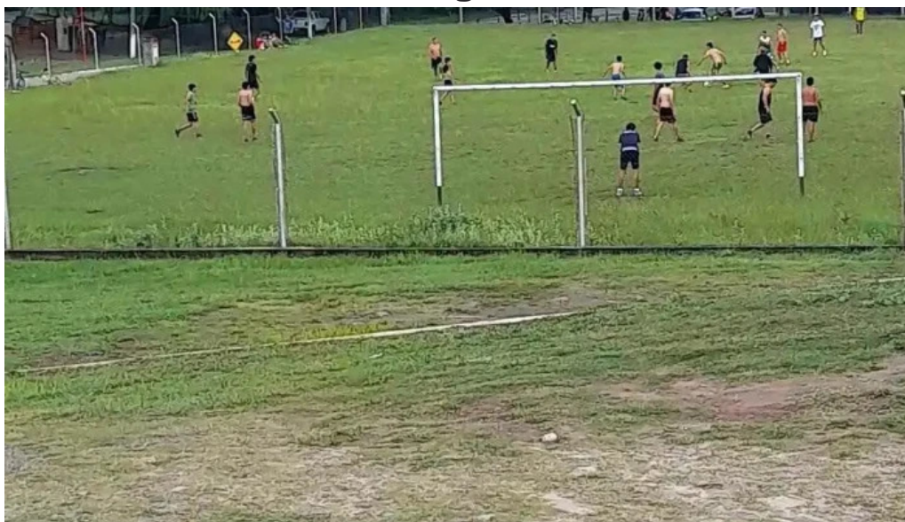
Posta de los sauces videos